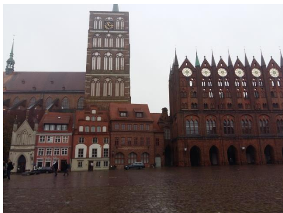
Stary Rynek. W tle kościół św. Mikołaja Oraz Ratusz.