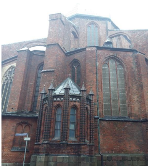
Łuki przyporowe kościoła św. Mikołaja