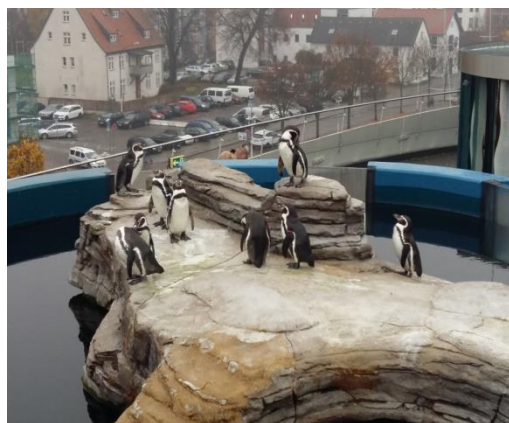
Wybieg Pingwinów Peruwiańskich