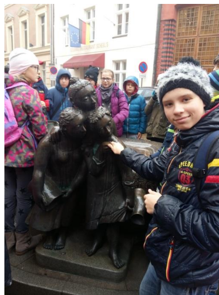
Jedna z fontann na Ryнку w Stralsundzie.